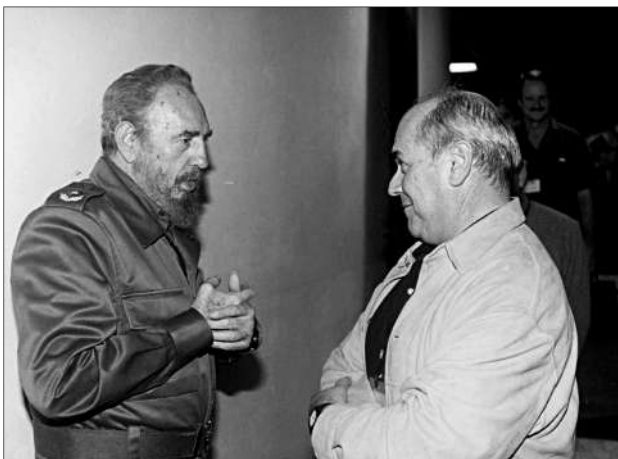
2002. Amb Fidel Castro, negociant amb les FARC.