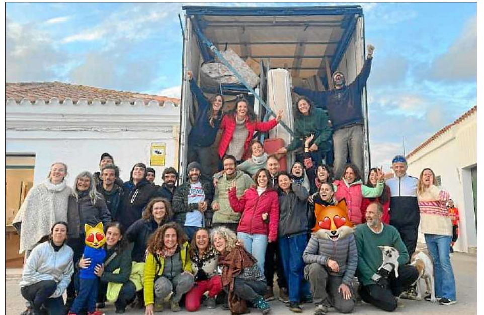
Menorca por Valencia des Mercadal va omplir tres camions amb mobles i electrodomèstics.