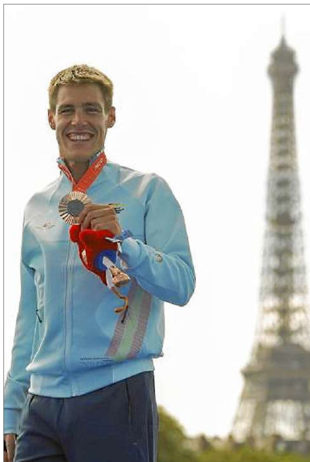
Nil Riudavets amb la medalla de bronze de les Olimpíades de París, amb la Torre Eiffel de fons.