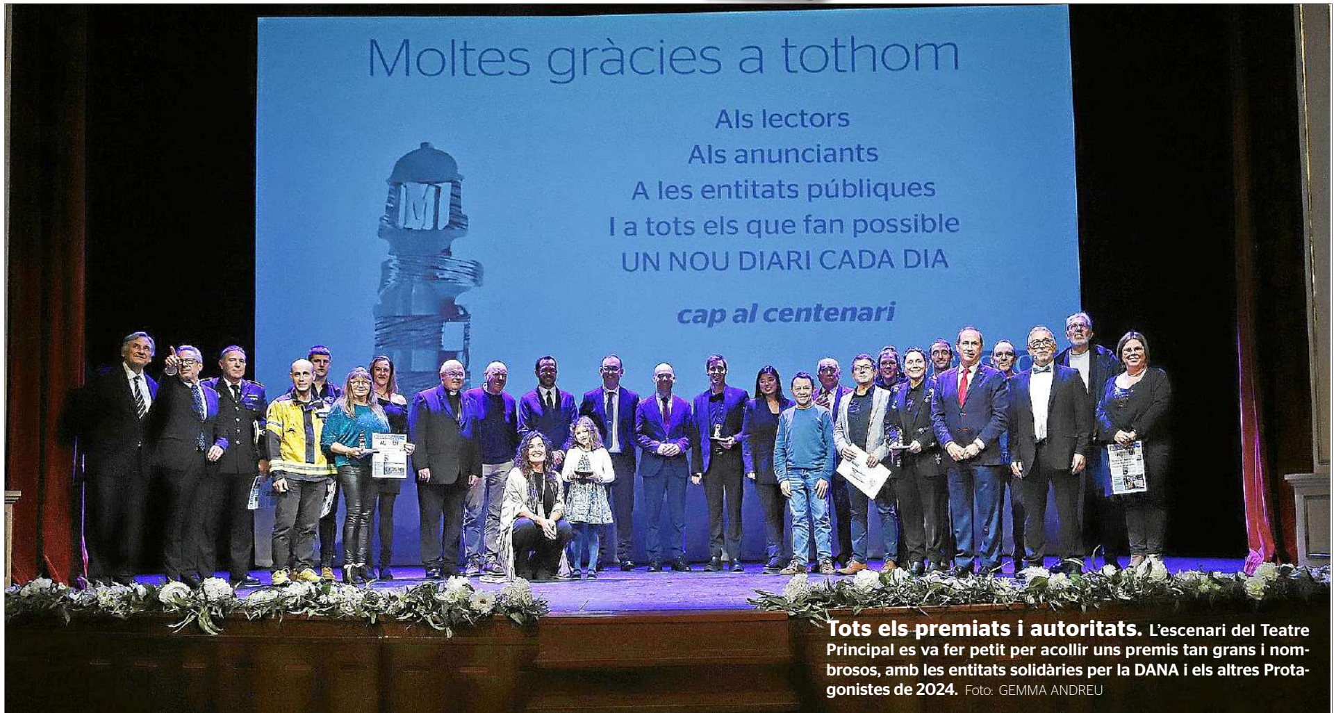
Tots els premis i autoritats. L'escenari del Teatre Principal es va fer petit per acollir uns premis tan grans i nombrosos, amb les entitats solidàries per la DANA i els altres Protagonistes de 2024.