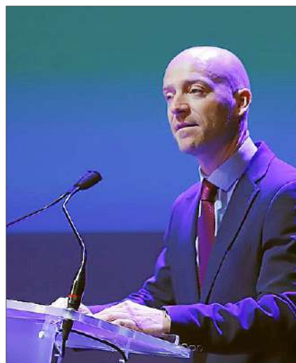
Vilafranca durant la intervenció.

Diari» a les persones que es van desplaçar als pobles més afectats o van col·laborar des de l'illa. No s'oblida de les persones que van ajudar a recuperar la normalitat a Alaior i es Mercadal, afectats pel temporal del mes d'agost, assegurant que «tots heu estat protagonistes de la vida menorquina».