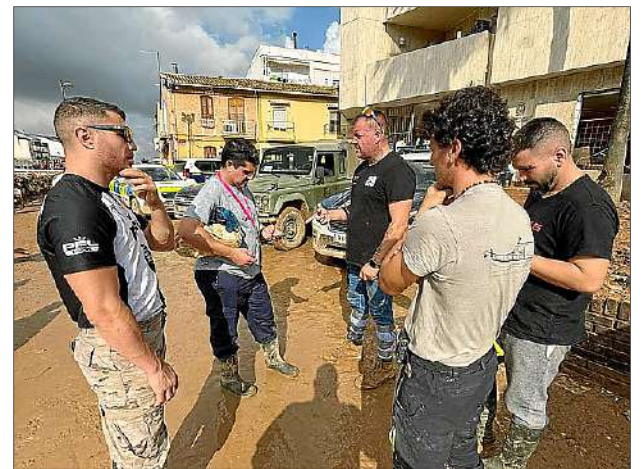
El grup d'electricistes durant l'actuació a València.