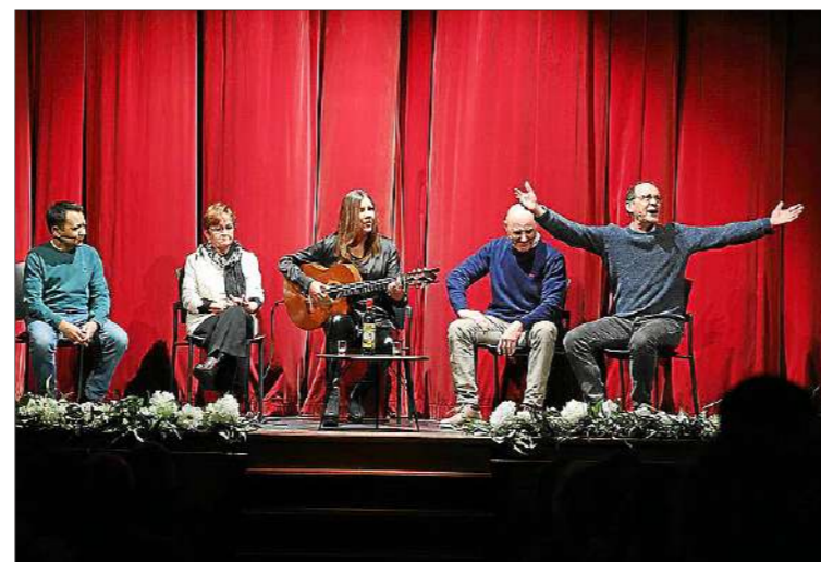
Gloses i música. Una mostra de glosat a càrrec d'improvisadors i sonadors de l'associació Soca de Mots va encetar una gran nit en què les actuacions musicals també van tenir el seu protagonisme, amb la posada en escena d'una gran dosi de creativitat artística i sentiment que el públic assistent va saber agrair.