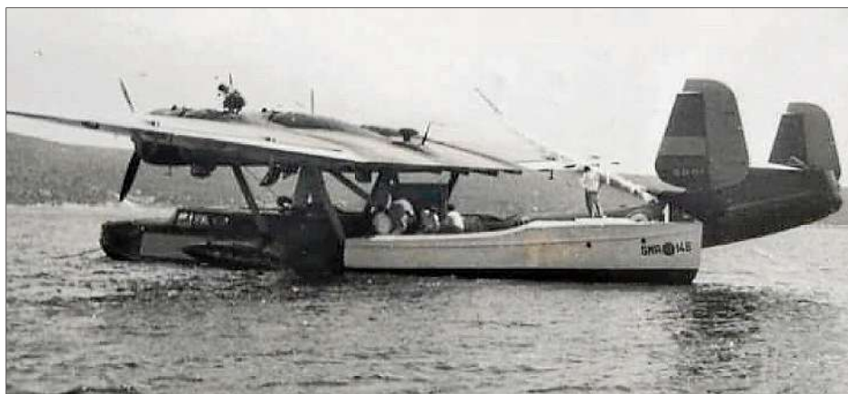
El hidroavió que va fer parada tècnica a Fornells en la ruta entre Marsella i Alger.