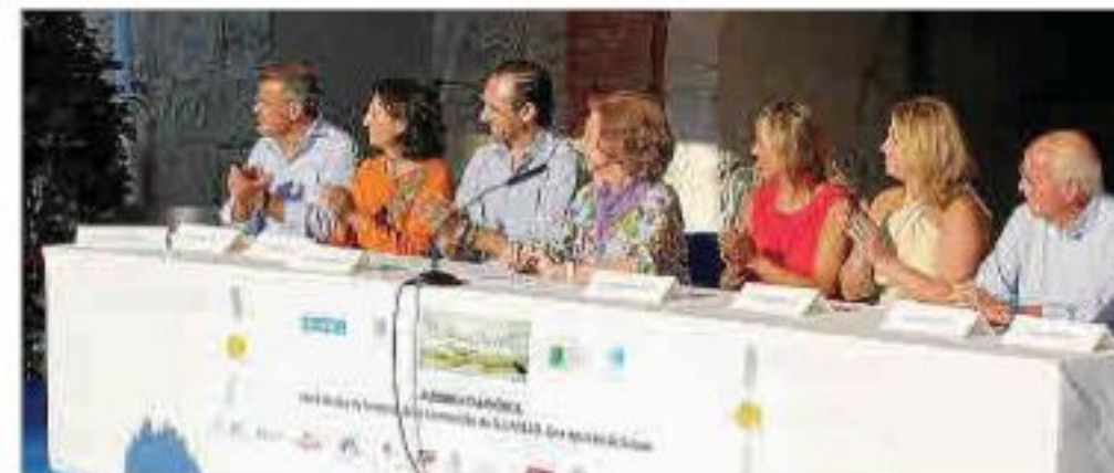
V Foro Menorca Illa del Rei que presidió la reina Sofía.