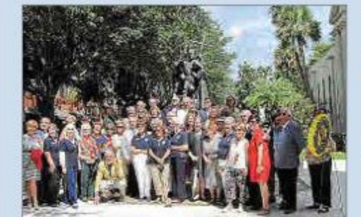
Visita a San Agustín

► En abril de 2023 viajamos a Cerdeña para conmemorar el 80 aniversario del hundimiento del acorazado «Roma» en el golfo de Asinara.