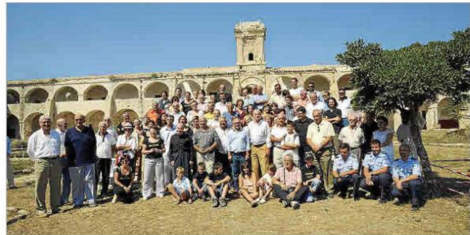
El rey Juan Carlos I, hoy emérito, en la visita que realizó a la Illa del Rei en agosto de 2008.

Además de los visitantes regulares (78.000 en 2024), hemos recibido en distintas ocasiones visitas ilustres, destacaríamos al Rey Juan Carlos I en visita privada (agosto de 2008), la Reina Dª Sofía, presidiendo el Foro Menorca Illa del Rei en 2013, los actuales reyes Felipe VI y Letizia en enero de 2023, con motivo de inaugurar la recuperada farmacia