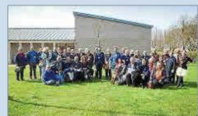
Visita a Somerset