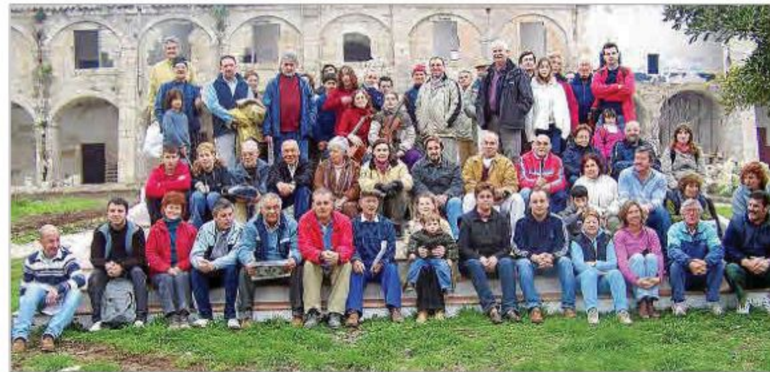
Desde el principio se ha dejado constancia fotográfica del trabajo de los voluntarios en el islote.

PATRIMONIO EL INFORME DE 20 AÑOS EN LA ILLA DEL REI