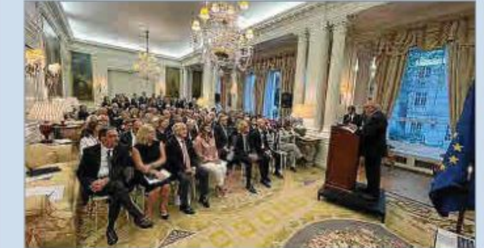
En la embajada de España en Londres

Se habían interesado por instalarse en la Illa del Rei y antes de acceder a su interés quisimos cerciorarnos de su actividad. La visita dio sus frutos